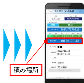
② 専用携帯端末に 行先表示