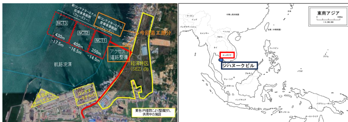
シハヌークビル港 新コンテナターミナル整備事業／拡張事業

同港の増加するコンテナ貨物需要及び大型船の寄港に対応するため、新コンテナターミナルの整備・拡張を円借款により実施中