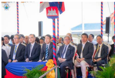
当社社長の参列（左）