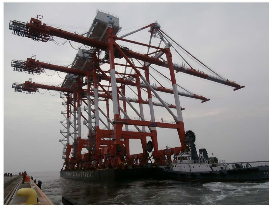
過去の台船運搬風景(2015.10 RC6/7用3基)