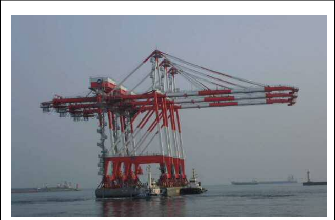
過去の台船運搬風景 (H25.9)